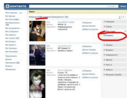
Типичные жители в типичном