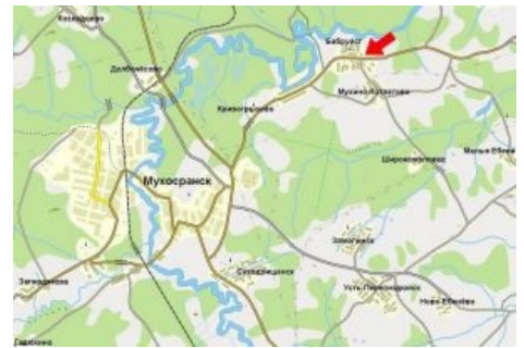
Карта Мухосранской области