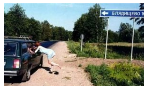
Центр культуры и цивилизации

Из архитектуры смотреть особо нечего — в центре сплошной частный сектор, есть сталинки, дальше идут хрущёвки , ну и современные окраины. В особо тяжёлых случаях — даже чтобы хрущёвку найти, надо поискать, самые высокие дома — трёхэтажные. Город маленький — с севера на юг пройти пара пустыков, а вот с запада на восток — надо напрячься. Особняком стоит микрорайон Хуево-Кукуево — там живут одни гопники, и даже днём туда заглядывать не рекомендуется.