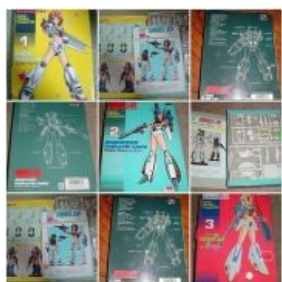
Моз гандам, внезапно 1985 год.