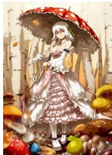
Вершина генной инженерии японских учёных — Amanita Muscaria Moetus

Очень часто мозморфизму подвергаются предметы из реальной жизни , игровые консоли, например. А японские транспортные фанаты чрезвычайно обожают персонификацию своих поездов. Фальсификация персонификация истории и геополитики — тоже не исключение. Ёнкома про Афганис-тан и веб-комикс про взаимоотношения стран мира Хеталия (даже не столько она сама, сколько фанарт с правилом 63 по мотивам) фактически целиком основаны на сабже . Мозэфикацию проходят герои мультфильмов и игр, в