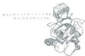
Шиитаке-тян, 2001 год