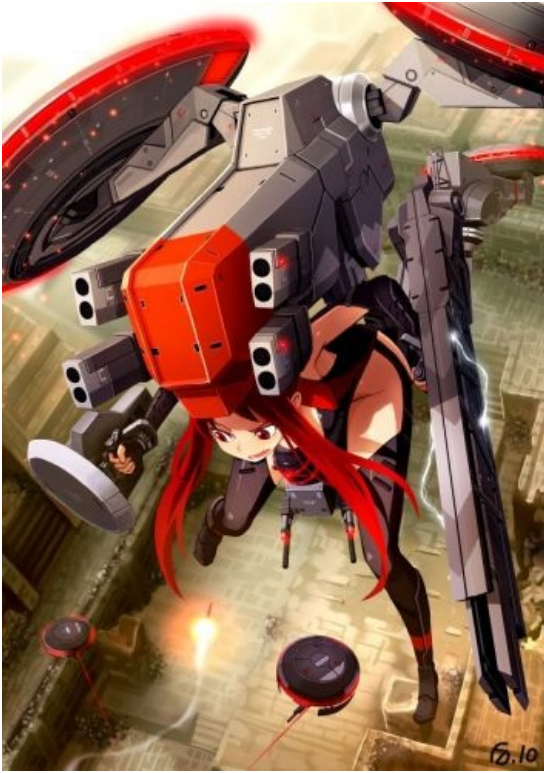
Меха из Metal Gear