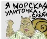
Будь улиточкой, блеать!