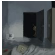
Пришествие улиточки в представлении анонимного художника.