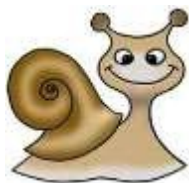
Оригинальная маленькая улиточка