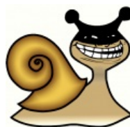
Комбо: Бэтмен + троллфейс