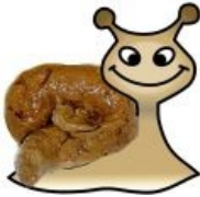
Улиточка одобряет копрофилию