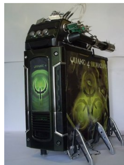
Quake 4. Impressive!

Немаловажно отметить, что любая сборка из магазинных комплектующих, если мыслить дальше своего носа и пустопорожних споров на просторах интернетов, по сути своей и является шоп-модом — разве что кроме случаев намеренного выбора самых слабых комплектующих категории «лишь бы работало», когда ОС грузится минут 15, Ворд не поспевает за скоростью набора текста и при этом в комнате стоит сильный шум, эмрад и гарь позволяющий говорить лишь на повышенных тонах. Что ни говори — а любой хомячок , за исключением уже упомянутой категории , собирающий систему себе лично, хочет собрать не «быдлокомп» в непродуваемом корпусе с верхним расположением и без того перегретого пустого как барабан блока питания , в котором под «ваттами» подразумеваются граммы собственного малого веса («блага» из него наши узкоглазые друзья выкинули всё, что только можно), а систему, за которую не стыдно, с учётом особенностей её эксплуатации. «Лишнее» бабло тратится во имя надёжности (качественный блок питания, мощное и при этом тихое охлаждение, сам корпус не консервная банка, а хотя бы «решето», обязательно с нижним расположением блока).