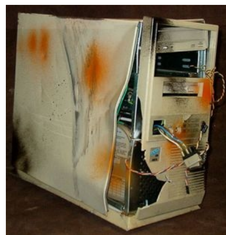
...и не очень