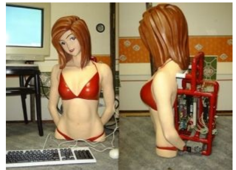
Ты не поверишь , анон, но она хочет играть!

Как на кухне, да. Берется барабан от стиральной машинки, магазинный манекен с сиськами, корпус от микроволновки/двд-плеера/старого видика/тумбочки и набивается до отказа комплектующими. Причем это могут быть как микро-ATX платформы, так и полноценные SLI-системы, с пятью DVD-ромами и встроенной кофеваркой. Вопрос охлаждения системы в данном случае — второстепенен, риальнэ патсану и для вывода 600 ватт тепла из корпуса достаточно одного лишь блока питания... на 580 , причём «заборных». Отдельные упоротые дезигнеры встраивают комп сразу в стол. Конечно же — отсек герметичен, чтобы не шумел и комнату не грел! И место экономит, и пацанички заценят. Помимо эстетического выебства, такой вид моддинга может носить и прикладной характер — встраивание полноценного компьютера на основе Mini-ITX матери в магнитольный слот тачилы .