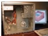
Новогодний моддинг (компьютер спрятан в блоке питания)