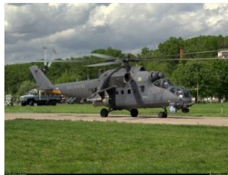
Эталонный Ми-35. Серый шарик под носом — это и есть оптика