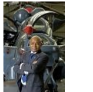
Два Чёрных Властелина на фоне друг друга.