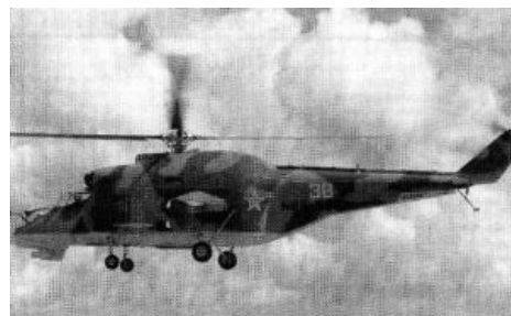
Косплей Ми-24 в США, слепленный из фанеры и говна

Критическое. 80-е кончились, и больше не нужно утюжить собственным бронированным носом вражеские окопы, высаживать десант в Чикаго, ебошить по «североатлантическим» танкам в упор и угорать по хардкору. В теории современные боевые вертолётки крушат домики с ослоебами с расстояния в несколько километров, даже не входя в зону поражения их пукалок. Впрочем, на практике ещё в Мали