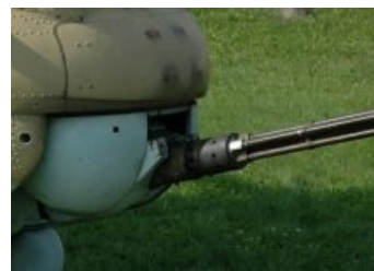
Советский миниган, таки вставлял не по-детски