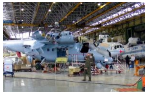
Ми-35 новой постройки на «Роствертоле». Инсайдерская фотка.

После начала реформ в армии заказчики из ВС РФ уделили пристальное внимание МИ-28, который, по логике вещей, является прямым наследником МИ-24. И военные, и сами инженеры вдруг ВНЕЗАПНО прозрели и увидели, что у вертолёта, на манер архаичных самолётов, к хвосту прикручено хвостовое колесо. Схема шасси такая. И как бы инженеры не пытались убедить военных, что их шасси служит защитой при падении, и вообще являет собой вундервафлю, заказчик остался недоволен. Использование вертолёта с хвостовым колесом мало того, что затрудняет рулёжку для пилотов, так ещё и требует переоборудования площадей базирования, и естественно, дохуя бабла. Осознание этого и чёткое понимание того, что выделение средств для модернизации со стопроцентной вероятностью закончится тем же, чем и всегда , заставило отказаться от этого варианта. Некстати пришлось и характеристики редуктора Ми-28, который из-за новизны конструкции от ремонта до ремонта крутится только 300 часов, против 1000 у сабжа. Короче, Ми-28 получился удачным прототипом, но для реального применения категорически непригоден. Сможет ли пролетариат МВЗ ИМ М. Л. Миля решить эту задачу — большая вопрос, так и оставшийся открытым, несмотря на то, что в интернетах и зомбоящике можно легко встретить бодрые, вселяющие надежду в сердца хомячков, рапорты о том, что