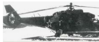
Тот самый опытный образец с фенестроном.

Ми-24 — первый в СССР вертолёт, где использовался так называемый «фенестрон», то есть рулевой винт в защитном кольце. Экспериментальная модель не нашла применения, потому сейчас их останки можно видеть только на свалках, а сохранившиеся экземпляры — в музеях.