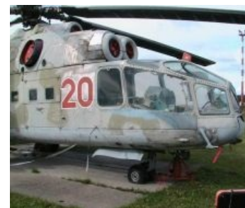
Та самая веранда

Ми-24 модификации «А» имел угловатое остекление, названное «верандой». Лётчики сидели практически бок о бок, и была вероятность того, что в случае обстрела из стрелкового оружия могли быть выпилены сразу оба лётчика. Пилот при таком расположении видел чуть больше, чем ничего. Ещё была проблема с обледенением всего фонаря кабины — иногда штурману приходилось прямо в полёте открывать кабину и чем-то соскребать лёд, чтобы улучшить обзор. После доработки напильником и эпоксидкой лётчики сидели в отдельных кабинах с выпуклыми стёклами. Пилот сидел в верхней кабине, а штурман-оператор — в нижней. За свой внешний вид вертолёт получил прозвище «крокодил».