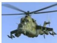
К доминированию Доминирую. готов.