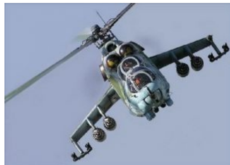
Крокодил брутален и бессердечен

Ми-24 (разраб. «изделие 240 (242, 246 и т. д.)», пенд. натовск. Hind — «лянь», рус. армейск. «крокодил», «горбатый», «полосатый», «рашпиль», «напильник», «шмель» (модификации Ми-24А и Ми-24Б имели прозвище «веранда» или «стакан»), душманск. «шайтан-арба») — эпичнейший советский и российский боевой вертолёт. Наравне с Калашом и Уралом является широко известным символом советской тоталитарной военщины.