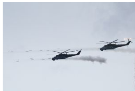
Ведёт огонь НУРСами. Отлично видна их «высокоточность»