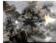
Кабина Ми-24, поставленная на ОБЧР , делает его вдвое брутальнее.