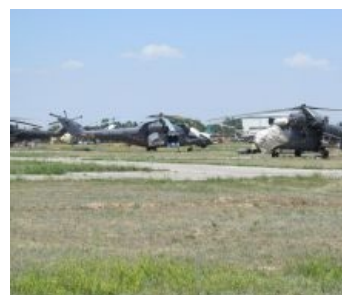
Ми-24 ВВС России справа, слева — Ми-35.

Тот самый опытный образец с фенестроном.