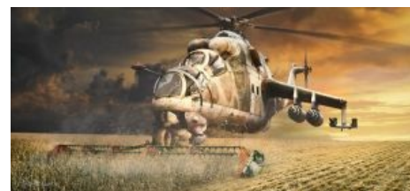
Мирный советский трактор

Из-за своей символичности крокодил присутствует практически во всех фильмах и играх, где описаны конфликты недавнего прошлого/настоящего/недалёкого будущего. Игра получает +1 к пафосу за показанный атакующий Ми-24, +2 — если на нём дадут полетать, +3 — если его предстоит выпилить в качестве левел-босса, +4 — если голыми руками . Вообще образ Крокодила — это образ Империи и Оси Зла, так что со стороны массовой культуры к нему внимание повышенное, но преимущественно — как к противнику.