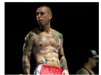
А в этом живет с 2006 года и по сегодня

«Ляпис Трубецкой» старого образца была, казалось бы, аполитичной группой. Стёбные шансонные и попсовые шлягеры веселили и бодрили, но крамольным подтекстом не баловали. В то же время Ляписы лабали на концертах эпичнейший кавер песни про Буратино, где оставлены оригинальные слова куплетов, а в припеве «Бу-ра-ти-но» заменен на «Лу-ка-шен-ко». Получалось