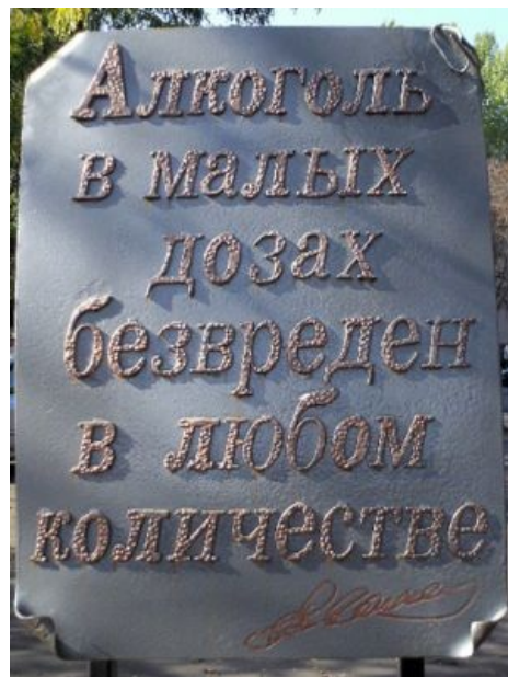
В Одессе на бульваре имени его