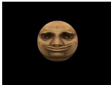
Сферический МихМих в вакууме