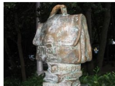
Статуя портфеля М. М. в

Консерватория, частные уроки, ещё одни частные уроки, зубные протезы, золото, мебель, суд, Сибирь. Консерватория, концертмейстерство, торговый техникум, зав. производством, икра, крабы, валюта, золото, суд, Сибирь. Может, что-то в консерватории подправить?