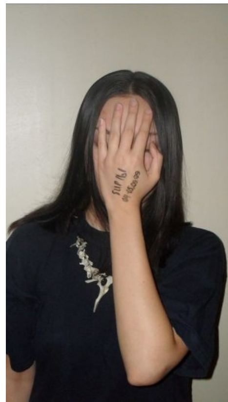
Фото, добытое быдлоилитариями

На протяжении этой истории в деанон-тредах тусовалось огромное количество неймфагов и прочих недоанонов. Многие из них действительно были заинтересованы в поиске котоубийцы, а большинство просто ловили лулзы. Собственно, персонажи: