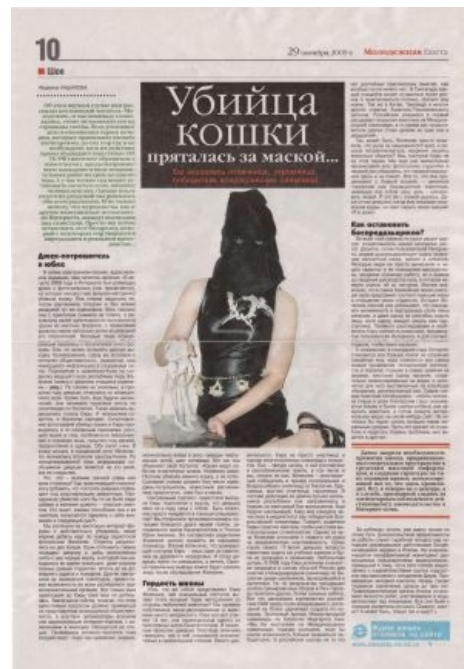
Уфимская пресса о Маске-тян

С мест сообщают, что виновницу торжества отчисляют с ФРГФ за прогулы. До этого она была также отчислена из мединститута (в который поступила вне конкурса благодаря победе во Всероссийской олимпиаде по биологии) за академическую неуспеваемость.