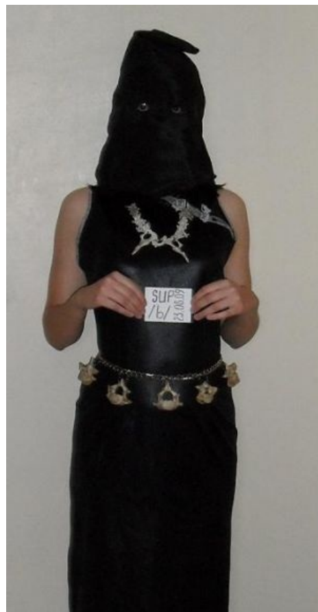
Маска-тян. Позвонки на поясе намекают, что кошечками дело не ограничивается

Несмотря на утверждения самой Маски-тян, что она хотела лишь доставить 3,5 анонимам, которым это понравится, действия её вполне ожидаемо вызвали неистовое бурление говн галактических масштабов.