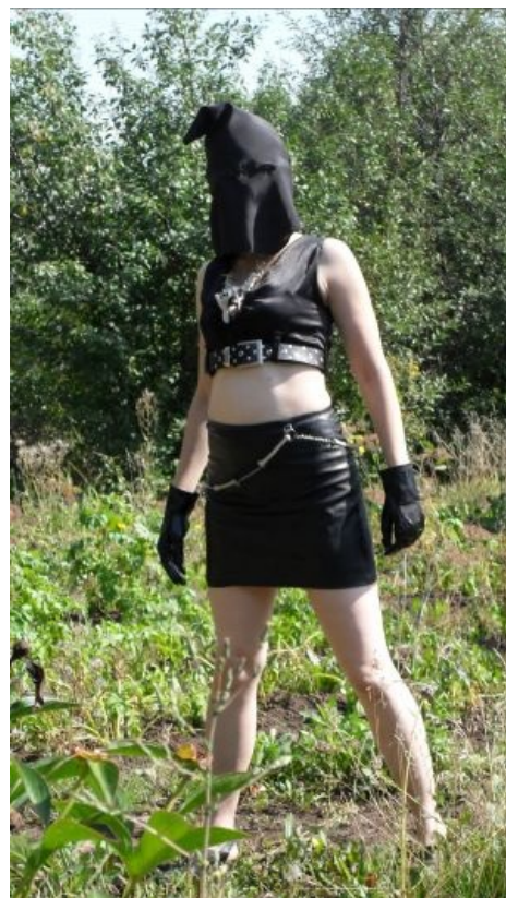
Местность Больших Усеров на фоне Маски-тян. Здесь собственно и было проведено «раздевание» несчастной кошечки

Во-первых, должна отдать должное доблестным шерлок-холмс-кунам. Некоторые из них блещут завидным умом. Однако хочу напомнить, что не следует недооценивать своего противника. Я не недооцениваю Легион и не хихикаю над фейлами, но и не дрожу под одеялом. Но и Легиону не стоит думать, что у такого параноика, как я, есть блогик или вконтактик с фотографиями в костюмах амулетах. В Интернете нет моих фотографий. Это не дезинформация и не ложный след: я просто не хочу, чтобы от травли пострадали невинные вроде того гота. Кстати, реквестирую крысу-куна, который донесет до него совет сфотографировать свои длинные волосы и волосатые руки в качестве доказательств, что его нет на моих фотографиях. Если честно, я не знакома ни с одним из подозреваемых. Вы, конечно, не поверите, но у меня есть чувство справедливости и даже совесть. Не хочу, чтобы вы искали козлов отпущения. А если некоторые недобросовестные анонимусы специально начнут травить невинных, чтобы заставить меня сдаться, это будет не только подлый и недостойный, но и наказуемый поступок. Как известно, незаконный сбор информации, вмешательство в частную жизнь, угрозы и клевета тоже уголовно наказуемы. А уж если вы собираетесь вершить самосуд над человеком, милиция точно разворошит уютненький в поисках айпи участников этого преступного сговора. То есть угроза деанонимизации и