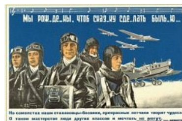
Стахановцы-боевики — ужос, летящий на крыльях ночи

Так или иначе, Сева тиснул в августе 1983 года педерачу на ВВС, где связал «Марш Авиаторов» с официальным гимном идеологического противника, естественно, отдав пальму первенства не еврею Хайту, а настоящему арийцу. Чем не только сел в лужу, а громко и ЖИДко в луже пернул. Три года понадобилось заслуженному троллю, чтобы найти пруф , но нашел таки. И в 1987 году про этот случай раструбил на Би-Би-