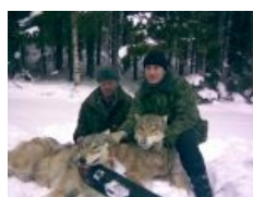
Рейд несогласных с волками по лесу