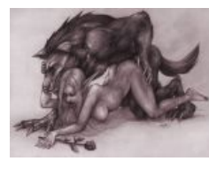
Воргены — союзники эльфов