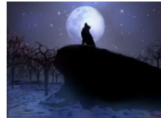
Одинокый волк. На фоне луны. Воеет от голода.

Отдельно стоит упомянуть подкатегорию — волк-одиночка. Абсолютнейший нонсенс в природе, документально подтверждён Джеком Лондоном. Субъект, не следующий абсолютно никаким правилам и установленным нормам ( на него всем похуй , как и ему на всех) и изредка от остальных волков огребающий. Тем не менее 95% всех волкофагов считают себя исключительно одиночками, не принимая в расчет, то, что волк прежде всего стайное животное. Такой экземпляр может часами рассказывать о том «какие волки гордые одиночки» и как он их понимает, естественно, что плохая стая — это общество, а он не понятый и отвергнутый всеми герой .