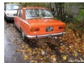
ЛОХ и Жигули (моар лохов)