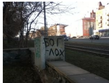
И даже небо...

различных к тому времени криминальных элементов, столичных любителей пожить за чужой счёт и торговцев, обувающих их на рынках. К слову, в финском языке слово «lohi» также обозначает лосося («merilohi» — «сёмга») и т. д. А в уголовном жаргоне слово появилось позже, искусственно. Весь гопничий и зековский аргумент состоит из подобных аббревиатур (лох, чмо , бич, стон, слон, кот).