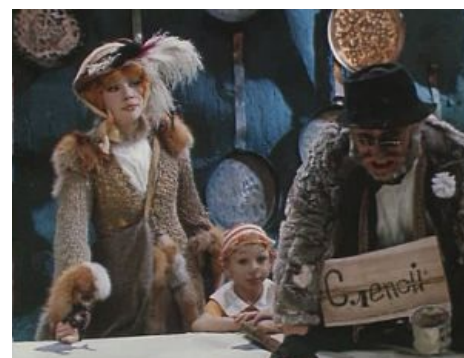
Лох в процессе «окучивания»