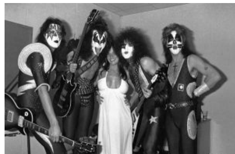
Вместе с Kiss .

Нужно упомянуть и про влияние «Глотки» на культуру в целом. Тащемта , прямая отсылка к фильму есть в старой песне не менее старой Мандонны «Deerer and deerer», что в переводе с их американского на наш рассеянский означает « Глубже и глубже ». А вся книга Чака Паланика «Снафф» имеет прямые отсылки не только к фильму, но и к жизни самой Линды. Впрочем, в книге как раз и рассказывается история старой порношлюшки, которая решила уйти со сцены, снявшись в своём последнем фильме, где её должны отыметь 600 (!) мужиков. Да что так далеко ходить! Даже гусский пейзаель Эдуард Тополь вставил в свой роман «Чужое лицо» эпизод, когда дорогой Леонид Ильич Брежнев посмотрев этот фильм, настолько вдохновился названием и содержанием, что приказал так назвать сверхсекретный проект, связанный с бурением сверхглубокой скважины. Ещё один забавный момент произошёл, когда оказалось, что редактор одной газетёнки выбрал псевдоним «Глубокая глотка» для одной из подставных уток в Уотергейтском скандале [1] . В честь самой же актрисы некие программёры назвали придуманный ими язык программирования «Linda» [2] . Видать, в память о любимом фильме весёлого юношества. Да и много где упоминался либо сам фильм, либо просто его название, расписывать тут не будем, потому как превращение статьи в простыню — грех великий есть.