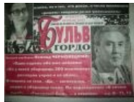
Сабж смотрит как-то озадаченно и одновременно с недоумением