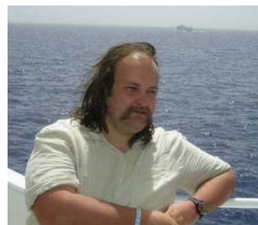
Ленский собственной персоной!