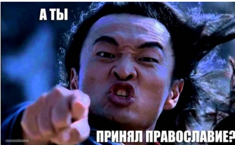
Призыв к действию