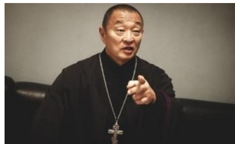
Истинно тебе говорю, дух твой вбираю в себя