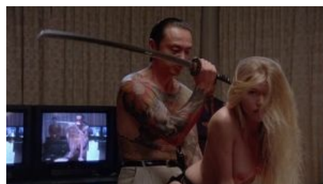
Приобщает шлюху к истинно правильной вере