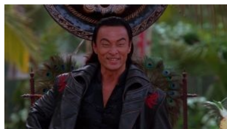
Шан Цунг такой Шан цунг