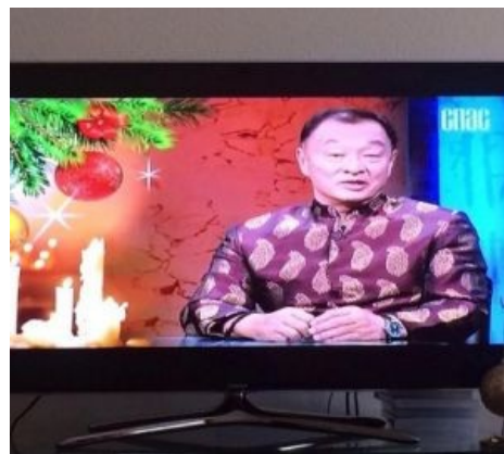
С рождеством, православные