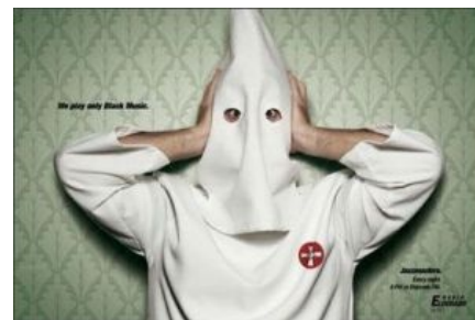
Ёбаный стыд, он таки стал президентом

Дьюк был вскоре отстранен от руководства Кланом, так как его соперник Дон Блек