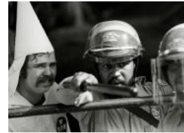
Чернокожий полицейский защищает ку-клукс-клановца от противников этой организации (Техас)