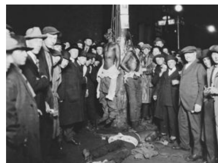
Известный западный мем