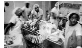
Ку-клукс-клановец в операционной (Алабама)

Чернокожий полицейский защищает ку-клукс-клановца от противников этой организации (Техас)