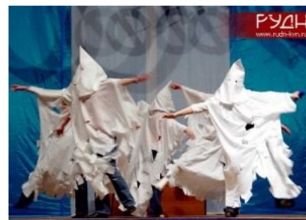
Ку-клукс-клан — это весело!

https://www.youtube.com/v=pqMoaR8kFQc Телепузики одобряэ КKK и Johnny Rebel'a!