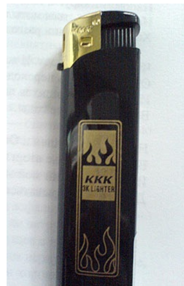
Kill it with fire