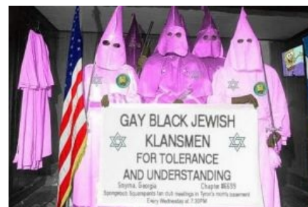
Толерастия на марше