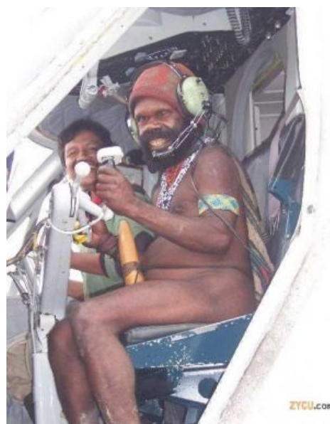
Поздний час, половина первого...