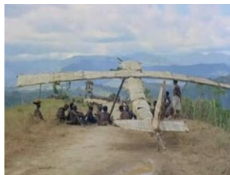
На этом самолёте нам привезут кучу ништяков