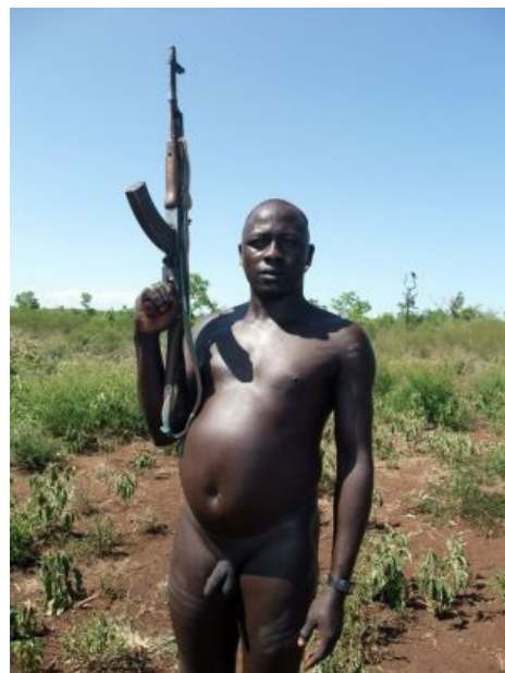
Не намоллил, а подарили отжал!