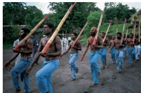
«Папуасы» играют в солдатиков