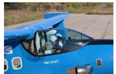
Крайний гламурный вариант