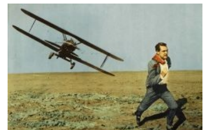
Биплан преследует жертву