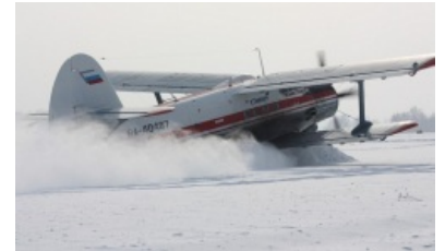
Кукурузнику не нужны «взлётные огни аэродромов...»