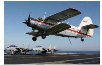
Чудо-оружие нашей армии

Причем первый из них — WSK-Mielec M-15, прозванный за уродливый внешний вид «Belphégor» — советско-польская конструкция. Наверное, это единственный в мире реактивный биплан и единственный в мире реактивный сельскохозяйственный самолёт. Было произведено всего 175 штук, после чего проект благополучно слился. Отечественные участники разработки М-15 винят инфраструктуру в неготовности обслуживать прогрессивный самолёт.