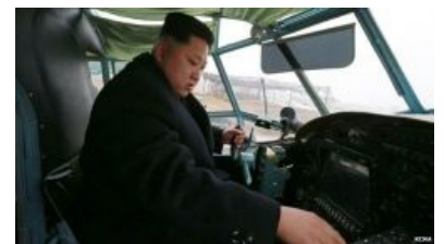
АН и БН