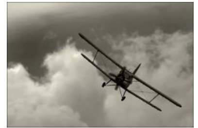
В воздухе он весьма стремительный

По сравнению с чудом нольежкой таки советской конструкторской мысли М-15 «Belphegor» или австралийским Transavia PL-12 выглядит вполне