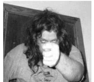
Куковлев как бы говорит тебе

В транслите ДВКшным терминалом получается Qkowlew, что и стало его ником еще с эпохи ДВК. Маньячил вплоть до первого в Москве считывания с ЕСовских лент на мелкие машины (опять же ДВК) Сильмариллиона и попытки хранения текстового архива на перфоленте, для надежности по сравнению с тогдашними 5" дискетами (заяв роликami наперфорированного все подполье немало машинного зала).