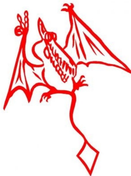
Портрет Красного птеродактиля Арчибальда, на юзерпик потраченный