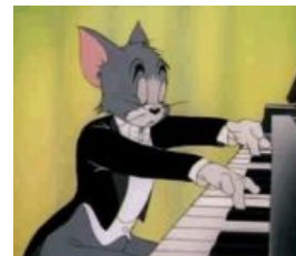
Том знает толк в сабже

Кошачий концерт — многозначное слово, доставляющее как в прямом, так и в переносном смысле.