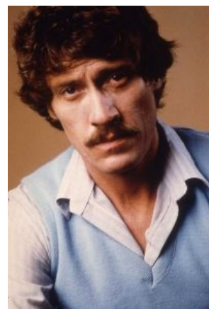
А это его двойник Джон Холмс . И занимается он примерно тем же самым