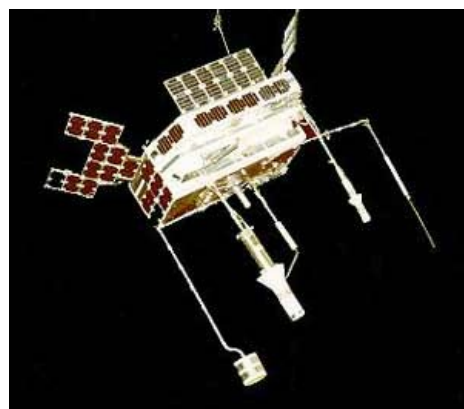
Злой спутник-шпион тянет тентакли к советским локаторам

Что же касается действий перехватчика, маршал врал на голубом глазу: