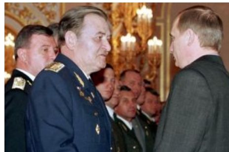
ВВП благодарит генерала Корнукова за службу