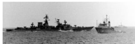
Толкучка в Японском море. Слева советский крейсер, справа что-то американское