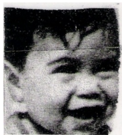
Самый младший пассажир (8 мес). Ня