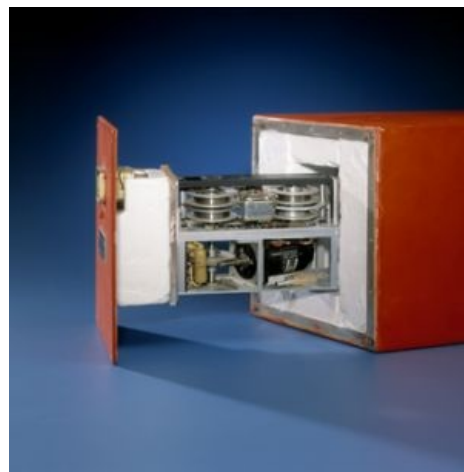
Черный оранжевый ящик

Судя по записям параметрического самописца двигателя были в норме, а значит, ракета с тепловым наведением их не поразила. Ракета с РЛС-наведением, скорее всего, взорвалась в конце