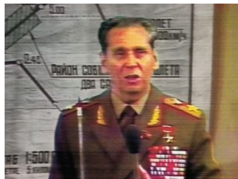
Маршал Огарков лечит мировую общественность

Через неделю стало ясно, что бурление говн только разрастается, и отмолчаться не удастся. Надо было лепить отмазки. Столь важное дело поручили не абы кому, а цельному Начальнику Генерального Штаба маршалу Огаркову. 9 сентября при полном параде, с указкой, на фоне карты Дальнего Востока маршал убедительно разъяснил, что «людей, конечно, жаль, но ПВО отработало правильно», и это была тщательно спланированная шпионская миссия США по вскрытию системы советской противовоздушной обороны. Выступление, как водится, состояло из трех частей: правда , добросовестные заблуждения и наглая ложь . К правде следует отнести чёткое, по-военному краткое, но обстоятельное описание разведывательных сил и средств вероятного противника. А заблуждался начгенштаба в следующем: