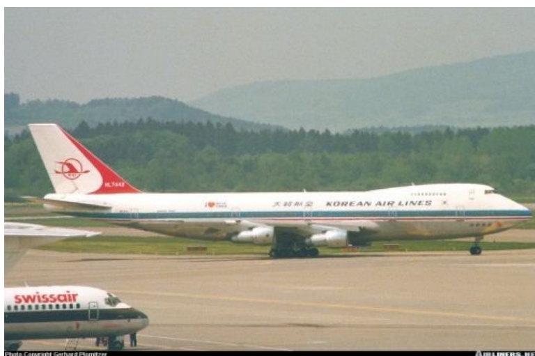
Борт номер HL7442