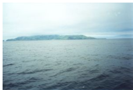
о. Монерон. И никто не узнает,