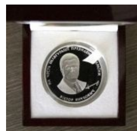
Монета с ликом Профессора

— http://politics.comments.ua/2011/06/22/266470/yanukovich-podaril-zhurnalistom.html