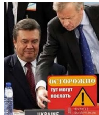
«Языком не болтай»

На реплику, что он имеет в виду, Янукович ответил: «Языком не болтай». После этого Лидер развернулся и ушёл. [14]