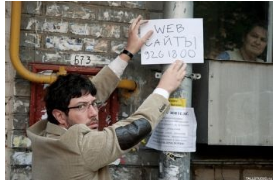
Последствия кризиса для обыкновенных дизайнеров.