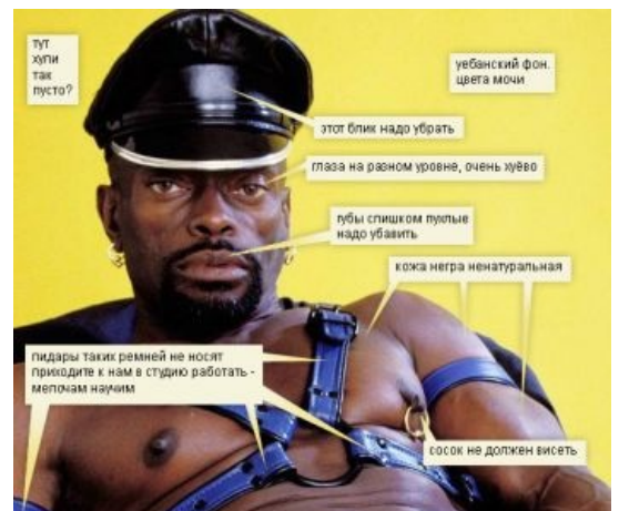
Ваш дизайн огорчает негров