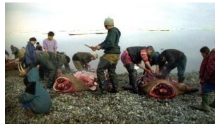
Кулинары свежую будущую нямку