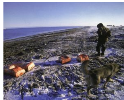
Морж уже порезан на кусочки. Чукотка, начало XXI века

Это незавершённая статья. Вы можете помочь, исправив и дополнив её. В эту статью следует добавить: побольше фантазии и/или маянезика