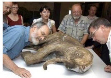
Копальхем имеет примерно такой же цвет