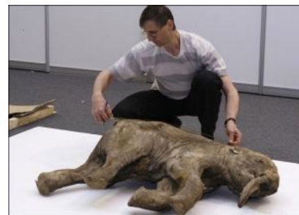
Неандертальцы тоже готовили копальхем

А теперь самое главное: северяне вообще невосприимчивы к «трупному яду», то есть к этой самой смеси высших аминов, поскольку приучены к употреблению слегка подтухших продуктов (а также к питью оленьей крови мочи, например) с самого детства. Это хитрое явление не врождённое, а сформированное родителями, которые с детства кормят чучку гнилятиной. Разложение этих ядов происходит в печени системой цитохрома P450, которая более точно так же есть и у нас. Разница только в эффективности работы этой системы. Цитохромов P450 существует более 9000, это целое семейство ферментов — CYP. У человека имеется 59 различных ферментов цитохрома 450, относящихся к 18 семействам и 48 подсемействам.