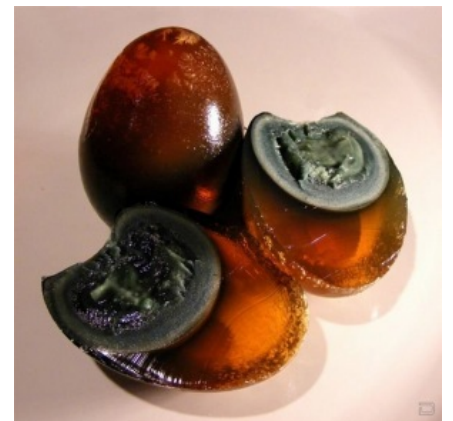
Скушай, доченька, яйцо