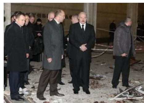
Метро проверил [1] .