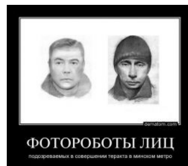
Преступники. Wait. ОН SHI.

Два друга детства (1986 г.р.), родились и жили в Витебске, в школе учились плохо, закончили ПТУ, отслужили в армии, работали: один токарем, другой — электриком. Это афганские террористы проходят через обучение в специальных лагерях на территории Пакистана, белорусским же достаточно гремучей смеси из ПТУ и армии. Жили с родителями, читай: были под присмотром. Ничем не примечательные работяги, ранее не задерживаемые и ни в чем не подозреваемые. Имелись странички в контактике, ныне выпилены за отсутствием хозяев. Вообще, информация о них довольно противоречивая, так как знакомые разделились на два лагеря: учительница химии + пару «друзей» vs. родные + остальные немногочисленные друзья. Первые говорят что-то вроде «скрытные, необщительные», вторые — «открытые, общительные».