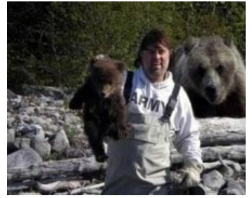
Еще как предсказуем.