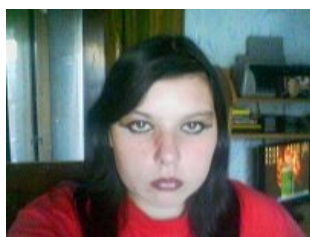
Женский вариант колхозника

Выглядит либо как ходячий пиздец шмара , крашенная жутко вульгарно, либо как разжиревший голем Франкенштейна. На выходных практически всегда следует за мужем, в городе обычно провисает в магазинах одежды (а чаще — на рынках). Голос, как правило, громкий и дребезжащий.