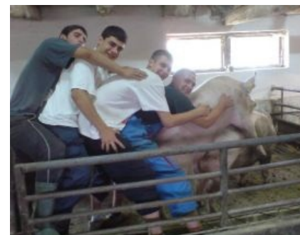
У них там своя атмосфера