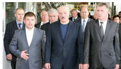
Главный колхозник и его свита