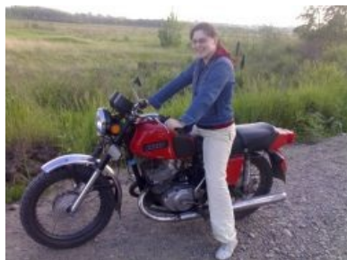
Сабж на мотоцикле

Сказати про життя, як це, Вася, було в житті... розумієте пацани? Всі пацани і тьолки... розумієте, в житті, Вася, буде всьо ніштяк, я вам... я вам за це атвічаю. Життя — цей вещь, яка, Вася... ніхто не паймає цій вещь... і цю вещь... тяжко пОняти. Ї тільки можна пОняти, коли ти гулешь с пацанами і тьолками з якими ти знайомий давно... І це все, Вася, буде з нами давно знакове... панятно. Пацани, скажіть!..