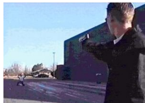
Кадр из фильма Эрика и Дилана

Последним, сверхэпатирующим поступком Эрика и Дилана стали съёмки фильма про расстрел в школе. Одолжив у знакомых видеокамеру и оружие с холостыми патронами, парни сняли фильм, сюжет которого фактически повторился во время настоящего расстрела. В фильме Эрик и Дилан подробно рассказали, как они ненавидят общество и одноклассников, после запечатлели процесс изготовления трубчатой бомбы и тренировку в стрельбе по мишеням , а в финале «расстреляли» несколько человек во дворе школы. Роли жертв в фильме тогда исполняли друзья и знакомые будущих убийц. Съёмки фильма окончились за несколько месяцев до бойни. Готовый фильм Эрик Харрис выложил на своем сайте, а также пытался распространить через школьных товарищей. Троллинг IRL прошел не совсем успешно — о фильме узнали школьные «качки». Режиссёры были встречены в тёмном углу и награждены премией «Оскар» .