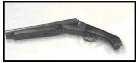
Обрез двустволки Дилана