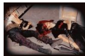
Смерть героев не может не быть красивой, ня!

Бойня продлилась чуть более часа. Погибло 15 человек, считая убийц, ранено было 24. Из них 21 получили огнестрельные ранения различных степеней тяжести; двое пострадали от осколков стекла, выбитого выстрелом из дробовика, и еще один повредил здоровье, попытавшись выбраться через вентиляцию. Такие дела .