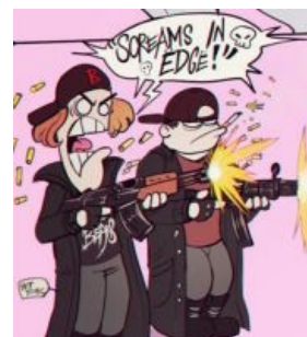
Вот как-то так всё и было

Эрик и Дилан перестали отождествлять себя с прочими одноклассниками примерно в 15-16 лет, когда вступили в неформальную школьную организацию « Мафия плащей » (англ. Trenchcoat Mafia ). «Мафия плащей» была чем-то вроде сообщества для решившихся подняться над школьными биомассами , выделиться из толпы. Большинство обычных учащихся насмеялись над странными «мафиози», над их одеждой, над увлечениями и привычками. Члены «мафии» одевались в одежду черных тонов, с презрением относились к современной индустрии развлечений, не доверяли властям (тогда в кресле президента сидел демократ Билл Клинтон), слушали тяжелый рок, любили читать Ницше и смотреть фильмы про нацистскую Германию. Популярностью среди сверстников они не пользовались, даже наоборот — им противопоставила себя более многочисленная группировка школьных спортсменов — «качков» (англ. jocks ), задиравшая членов «мафии». «Качки» не утруждали себя чтением философии и редко рассуждали о политике, зато они всегда были в центре внимания, их любили девушки , ими восхищались учителя и дирекция. Они были « светлым поколением Next », гордостью школы и города, и они всегда смотрели с высокомерным презрением на членов «мафии плащей» — по их мнению — непонятных, странных, жалких неудачников , «лузеров», живущих в своем мире и добровольно не желающих вписываться в систему .