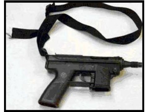
Тес-9 Дилана ВоДКи