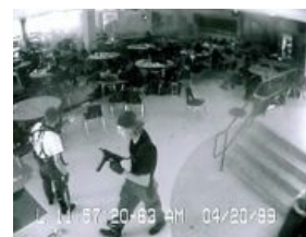
Этот кадр съемки видеонаблюдения обошел весь мир...

Эрик и Дилан обстреляли имущество школы, ещё раз пройдясь по пустынным коридорам. Несколько раз они заглядывали в классы, в которых находилось около сотни учеников, но уже не стреляли ни в кого. Позже следователи установили, что у ребят было достаточно патронов, чтобы убить как можно больше людей. Бомбы находящиеся в их машинах, должны были вот-вот сдетонировать. Чтобы увидеть это, они вернулись в библиотеку (перед этим оставив на кухне ещё пару бомб), где открывался шикарный вид на парковку. Но и тут их ждал фэйл (бомба Дилана частично сработала вместо 12 часов дня в 12 часов ночи). Постреляв из окон, но опять никого не задев, ребята сделали свои последние выстрелы .