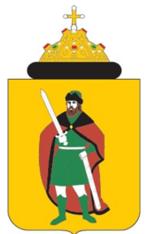
Малый герб Рязани. RLY.

Ещё коловрат — это что-то типа «славянской свастики», настоящее название которой никто не знает, но её очень модно чертить на стенах родного Задрищенска, рядом с исконно славянской надписью 14/88. Или же татуха с коловратом набивается на мощном бицепсе футбольного хулигана-патриота, между АСАВом и эмблемой местного Газмяса. Так-то.