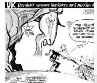
«Привычный козел отпущения больше не годится, нам нужно запилить нового»