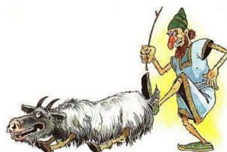
ЕРЖ изгоняет козла в пустыню