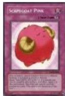
И даже так