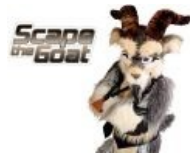
Козел смотрит на тебя, как на еврейские грехи