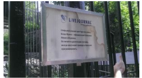
Табличка в зоопарке