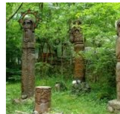
Первый хуй справа