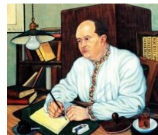
Традиционный костюм, перо, чифирь и сигареты — всё, что нужно для стимуляции вдохновения

Оригинал книги никто никогда не видел, а единственную(!) фотографию Миролубов держал за пазухой до самой смерти, случившейся с ним в 1970 году. Да и фотография эта сделана не с табличек, а с прорисовки на бумаге. Содержание книги представляет собой не то восхваление различных языческих богов, не то летопись, сведённую неким волхвом в IX веке н. э., и не соблюдает чётких правил орфографии, синтаксиса etc. Различные переводы отличаются друг от друга, летописные фрагменты не отражены в известной истории народов Азии и Европы, шрифт не имеет аналогов до появления кириллицы. Короче, подделка. Да ещё и довольно уёбищного качества. Но народ хавает до сих пор.