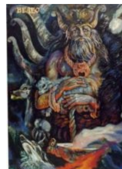
Гладит животинку, ня!