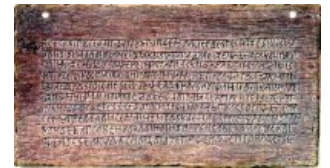
Памятник древнесловянской словейности

Текст был написан или нацарапан шилом, а затем натерт чем-то бурым, потемневшим от времени, после чего покрыт сверху лаком или маслом. Каждый раз для строки проводилась линия, довольно неровная. На другой стороне текст является как бы продолжением предыдущего, так что надо было переворачивать связку дощечек (как листы отрывного календаря). В иных местах, наоборот, каждая сторона была как бы страницей в книге. Сразу видно, что это многолетняя давность. На полях некоторых дощечек изображены головы быка, на других лучи солнца, на третьих изображения других животных, может быть лисы или собаки... Буквы не все одинаковой величины, строки были мелкие, а были и крупные. Видно, что не один человек их писал. Точное количество дощечек пока установить не удалось.