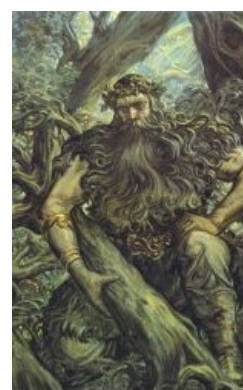
Леший? Нет, тоже Велес