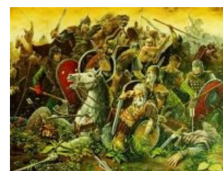
Сеча русичей и нерусей, например

Мужики не знали , но была ещё та Русь, границы которой охватывали громадные территории, а само государство было развитым и просвещённым. Оказывается, варяги во главе с Рюриком не пришли налаживать житьё по просьбе, а были тупо очередными узурпаторами. Своеобразный язык и оригинальная письменность была задолго до Кирилла и Мефодия, а культура и хозяйство находились на высшем для того времени уровне. Всё это целиком и полностью противоречило накопленным за долгое время знаниям, а значит — официальная™ наука скрывает (сторонники теории заговора и ZOG в этом месте понимающе кивают).