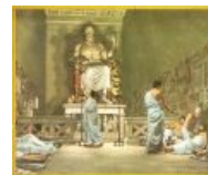
В храме Асклепия поциенты просто спали. Во сне медицинский бог сообщал больному способ исцеления.