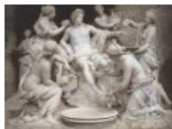
Аполлону недосуг смотреть на тебя.