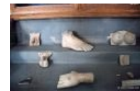
Исцелившийся заказывал мраморную копию выздоровевшего органа и дарил её храму.