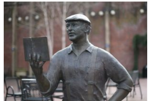
Железный дровосек читает дровосекам книгу про дровосеков

Стоит добавить, что и здесь имеет место экранизация, причем с именитыми Полом Ньюманом и Генри Фондой. Смотреть обязательно, если не ради хорошей, хоть и урезанной истории, то ради запаха свежих опилок, речной тины и вольного духа Америки самого-самого начала 70-х.