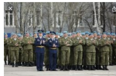
34-я десантная бригада.