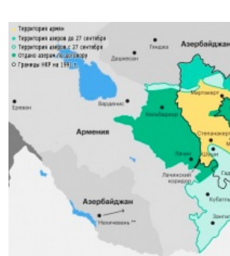
Карта Карабаха по состоянию на 10 ноября 2020 г.

Выходов к морю, в отличие от Крыма, Карабах не имеет, зато полон другой красоты, горных рек и ручьёв. Потому, пока эстеты плещутся в водопадах, экстремалы пробуют себя в рафтинге. Когда из-за скандала с послом и троллинга Пу в прямом эфире Габунией рашка забанила авиаперелёты, турпотоки кавказофилов (в основном, славян) незамедлительно перетекли к соседям, включая сабж. Вся эта кутерьма с