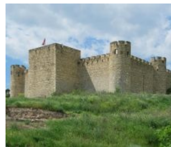
Крепость в Тигрянакерте.

блэкджеком и шлюхами продолжалась вплоть до мая 2020 г., когда запахло перцем и из-за горизонта замаячил хвост пушного зверька. Очень может быть, что по завершение очередной конфликт создаст курорту дополнительную рекламу.