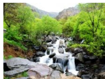
Водопад в Гандзасаре.

Монастырь Дадиванк. Несмотря на войну, реставрируется.