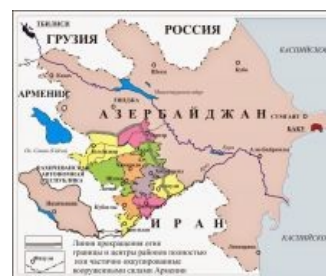
Линия фронта в октябре.