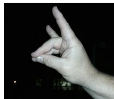
Знак Бозкурта. Нацизм — это стильно, модно и

У анон-куна, разумеется, возникнет резонный вопрос: из-за чего ары и азеры систематически выпиливают друг друга и не только (как оказалось, русских тоже)? Основная проблема в том, что они топят за противоположные вещи, а именно азербайджанцы настаивают на нерушимости границ, а армяне агитируют за самоопределение народов. И уже на основе этого стороны уходят в исторические срачи на тему того, чьи деды там раньше срали. В добавок к этому уже начинаются срачи помельче, в которых азербайджанцы обвиняют армян в нацизме, а вторые первых — в исламизме. Армянское большинство в ответ апеллирует к мирно живущим в Армении езидам, а азербайджанцы — к христианам и иудеям ( sic! ), мирно живущим в Азербайджане уже много веков. При этом, обе стороны имеют свои нацистские тусовки . У армян это террористы из АСАЛы, прославившиеся тераками в аэропортах и захватами турецких дипломатов , у азербайджанцев с турками же — ультраправые бозкурты (пер. с азер. «серые волки»), пытавшиеся однажды кокнуть самого папу