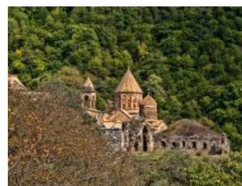
Монастырь Дадиванк. Несмотря на войну, реставрируется.