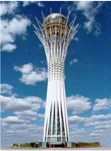
Символизирующий чуна-чуна байтерек такой символизирующий

населена русскими . Меньшую часть составляют понабижавшие из аулов местные, которые гордо называют себя титупной нацией . Неофициально эту область называют «Северными вратами», потому что население занимается более чем серьезными делами с вышеупомянутой страной. Именно в Северном районе находится столица, Нур-Султан (имен тоже было до хуя: Акмолинск, Целиноград, Акмола, Астана), превратившаяся за десять лет из нищобродского аула с покосившимися домиками в богатый город с новыми, блестящими небоскребалками и торговыми домами , которые в настоящий момент тоже уже перекосятся и периодически выгорают изнутри из-за некачественных материалов и электропроводки, что заставляет правительство срать кирпичами и искать виновных подрядчиков, которых на следующий год опять наймет строить очередной Байтерек . Собственно и расположение Ацтаны выбранно не случайно: граница Азии с Европой таки