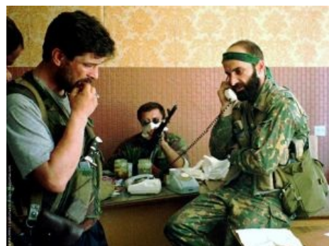
Поиск нового хостинга для КЦ (забанены IRL).