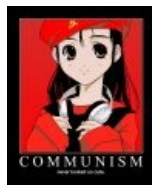
Коммунизм тоже подходит под определение «кавай».