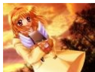
Мы говорим «кавай» — подразумеваем Аю . Мы говорим Аю — имеем в виду «кавай».