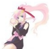
Лакс Кляйн , from Расово Gundam . Без комментариев.