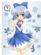
Кавайно? Сырно! И даже Т-34 -тян...