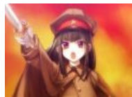
Расово имперский кавай.