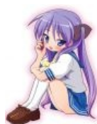
Лакистар — «каваен» чуть более, чем полностью.