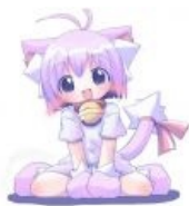
Сферический кавай в вакууме.