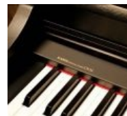
Мы говорим «кавай» — подразумеваем «Kawai».