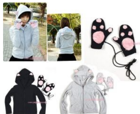
Пример кawaiiной формы.