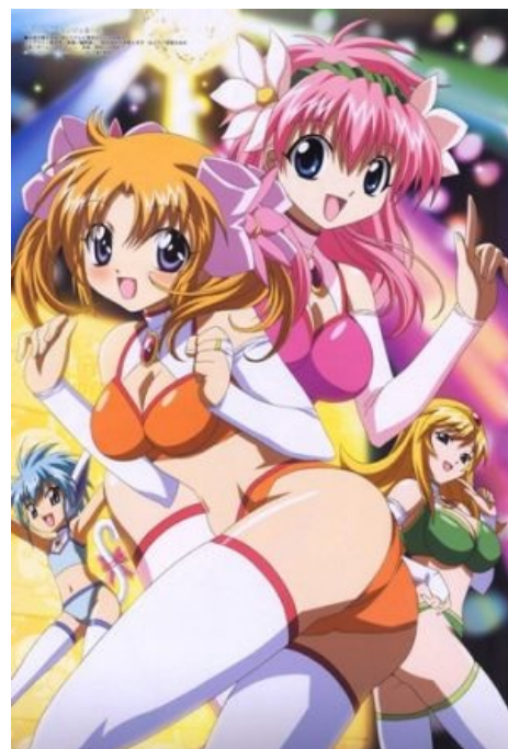
Кawaii и эчки в одном флаконе

В марте 2009-го слово «кawaiiный» активно форсилось мерзким каналом ЭмпТиВи , как синоним слова «сексуальный». Пруф можно отыскать в записи передачи «топ 10 самых кawaiiных (в оригинале „sexual“) женщин», а ещё были «Кawaiiные прелести Victoria's Secret». Fucking hardcore facepalm . На японском канале NHK продолжает выходить передача , чуть менее, чем полностью посвящённая kawaii.