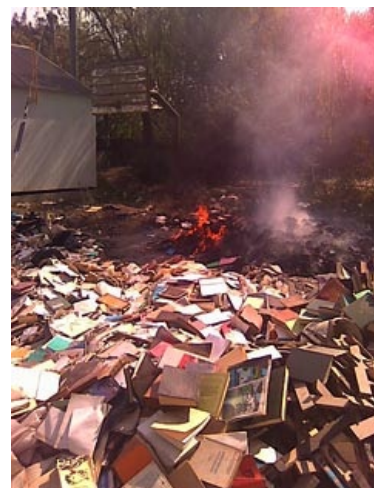
Сожжение Гёте. Цхинвал, 2009