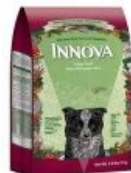
Иннова для щенков