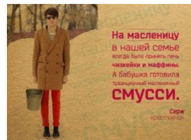
Деревенский хипстер [2] .

Каждый уважающий себя хипстер должен обладать говённой плёночной фотокамерой под названием «ЛОМО-фотоаппарат», названный так в честь советской фотокамеры «ЛОМО-компакт-автомат», которая ввиду своих уёбищных стёкол сильно загаживает фотографии, особенно при использовании цветной фотоплёнки (которую в СССР никто в здравом уме в «ЛОМО-компакт» пихать бы не стал). И внезапно все эти засветы, поплывшие цвета, размытость, виньетирование и прочий брак оказался по нраву хипстерам. Неадекват дошёл до такой степени, что цена на старый ЛОМО-компакт-автомат подпрыгнула с 10 до 3000-3500 р, а завод ЛОМО начал снова производить данный фотоаппарат. Причём рабочие так до конца и не поняли, зачем в наш цифровой век нужен фотоаппарат, фотографирующий хуже среднестатистической мобилы.