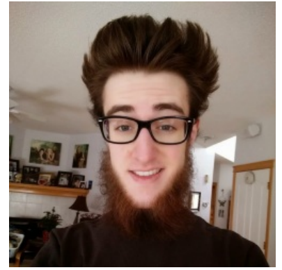
Джимми Нейтрон после того, как вырос и прокурил мозги