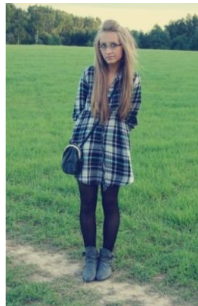
Типичная самка, коих дохуя нынче, вида инди-кид, в естественной среде обитания.