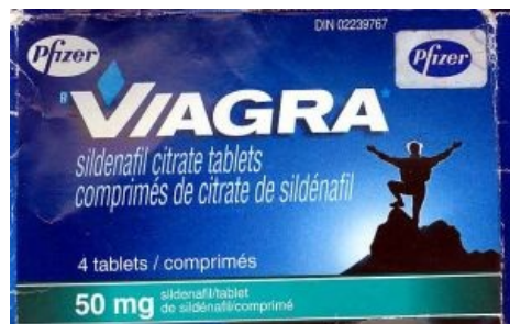
Виагра 50 мг

Сергей Шнуров . Аликапс Терминатор (теле- версия) Шнур тоже пользуется виагрой