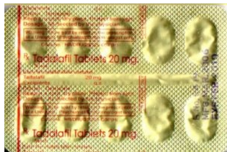
Дженерик Сиалиса (Tadalafil) 20 мг

Сергей Шнуров . Аликапс Терминатор (теле- версия) Шнур тоже пользуется виагрой