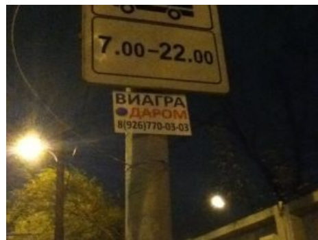
Замануха для лохов .

Два простых карандаша — просто примотай их изолентой к пинусу, слева и справа, и все эти новомодные лекарства нахуй не нужны. Ты только подумай сколько денег сэкономишь!