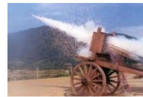
Стрельба из хвачхи — быстро и надёжно успокоит целый полк япошек

... а это WP 8, пшекский вариант РПУ-14. Найди десять отличий