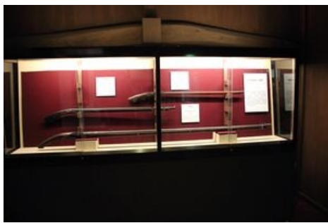
Размер имеет значение

Имдинская война стала причиной появления туёвой хучи разнообразных свистелок и перделок, что лишний раз подтверждает, что ничто не двигает прогресс лучше, чем война. Вот лишь некоторые нововведения: