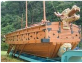
Сферический кобуксон в вакууме

Броненосец «Потёмкин» Корейский броненосец — кобуксон