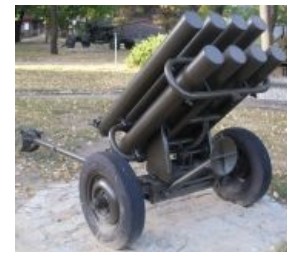
... а это WP 8, пшекский вариант РПУ-14. Найди десять отличий