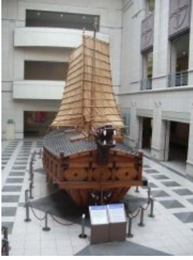
Броненосец «Потёмкин» Корейский броненосец — кобуксон