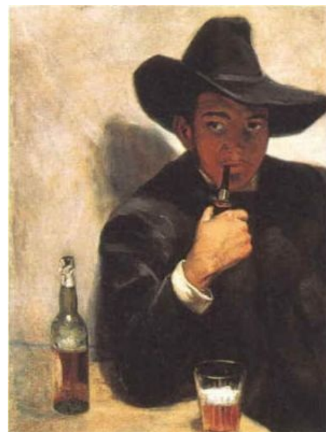
Диего Ривера. Возможный прообраз героя.