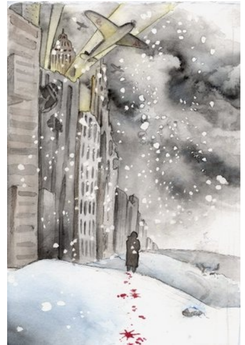
Так могла бы выглядеть Черная Москва