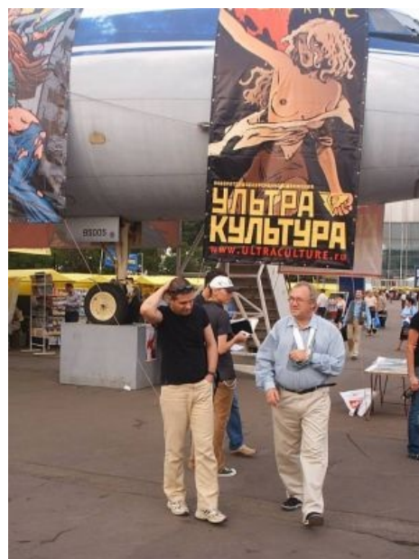
Типичная выставка Ультра. Культуры

Два года после смерти (2008 и 2009) происходило вручение премии