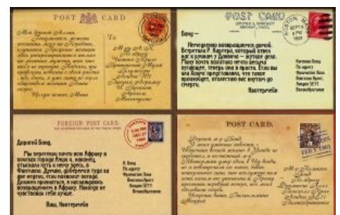
Предположительно, начало XX века