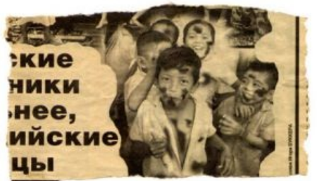
Оборотная сторона, замеченная на лепре