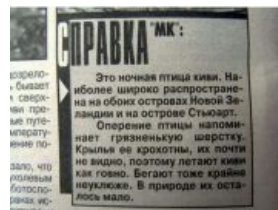
Хочу всё знать